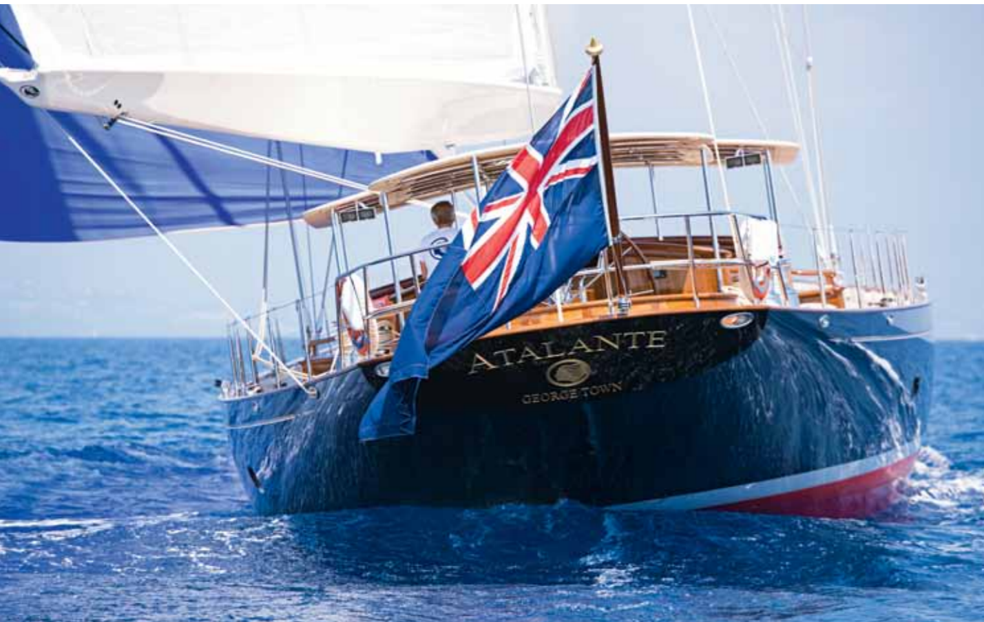
Erst beim Blick von achtern auf die 7,7 Meter breite ATALANTE wird deutlich, über wie viel Raumvolumen sie unter Deck verfügt. Erkennbar sind auch die harmonisch strakenden, geschwungenen Linien des Decks (oben). Foto unten: Das Bergen des Gross wird erleichtert durch Lazy Jacks und ein tief fallendes Segel. Das keyhole-förmige Bimini kann zum Bergen und Abplanen durch die Crew betreten werden.