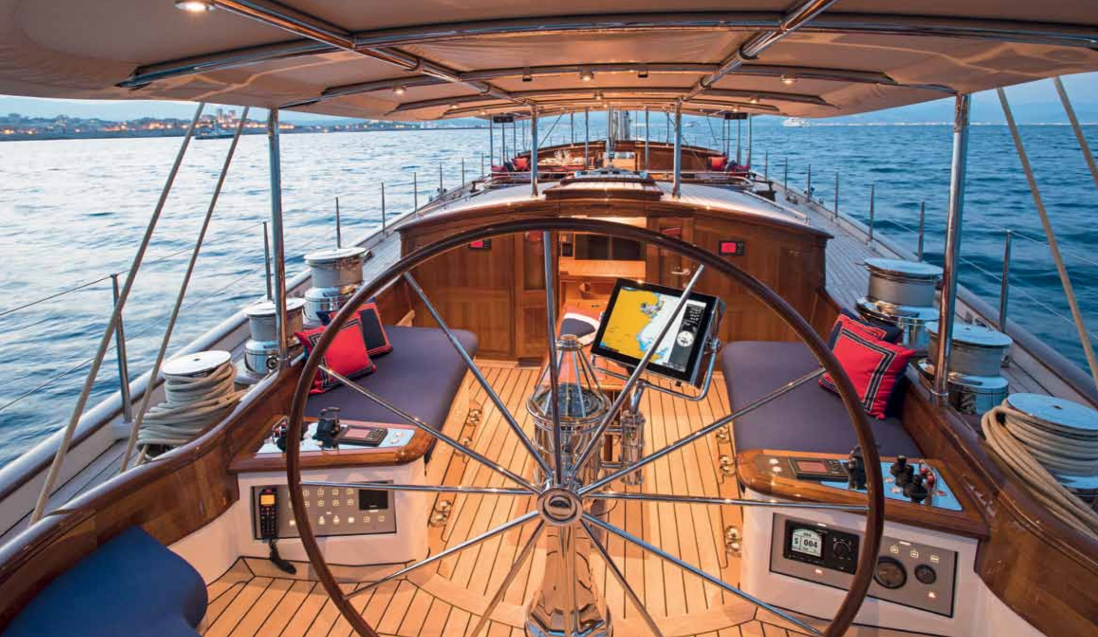
Der Steuerstand bietet ideale Voraussetzungen: Wer will, sitzt beim Steuern bequem an der Seite auf einem durchgehenden Sofa. Möglich macht das ein sogenanntes Keyhole-Cockpit, dem in der Form auch das Bimini folgt. Die Mitte des grossen, formschönen Steuerrades ziert das gravierte Claasen-Logo (siehe unten links).