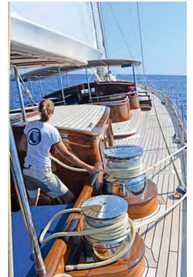
Vier Crew-Mitglieder können die 127 Fuss lange Yacht mühelos im Cruising-Modus bewegen. Bei Regatten müssten es mindestens dreimal so viele sein. Die teilweise selbstholenden Winschen sind elektrisch unterstützt.