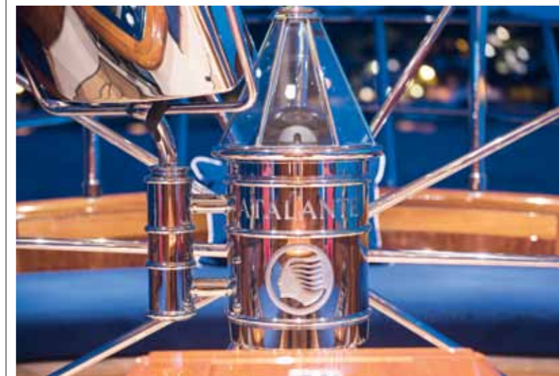
Auf Leichtwetter-Genua (oben) und auf der Steuersäule des Rades ist das Konterfei der Namensgeberin des Schiffes, ATALANTE, abgebildet. ATALANTE (griechisch Αταλάντη oder Αταλάντα) ist in der griechischen Mythologie eine jungfräuliche Jägerin, die Tochter der Klymene. Bei Jägern sei sie zur schnellsten Läuferin Griechenlands herangewachsen, heisst es dort. Mehrere Schiffe trugen und tragen diesen Namen, darunter mehrere französische Fregatten, ein Forschungsschiff sowie ein Bulkcarrier.