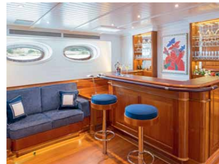
Warme Mahagoni-Töne in Kombination mit weissen Wänden und Decken werden kontrastiert durch Edelstahl und ergänzt durch Teppiche und einen Multifunktions-Tisch aus Leder in Beige-Tönen. Von oben nach unten: Master-Salon, Backbord-Seite, Doppelbett (links davon Zugang zum Kapitän's-Navi-Deckshaus per Luftdruck-Schiebetür) und Master-Salon, Steuerbord-Seite, mit Bar und direktem Zugang zum Control-Raum (im Foto nicht sichtbar).